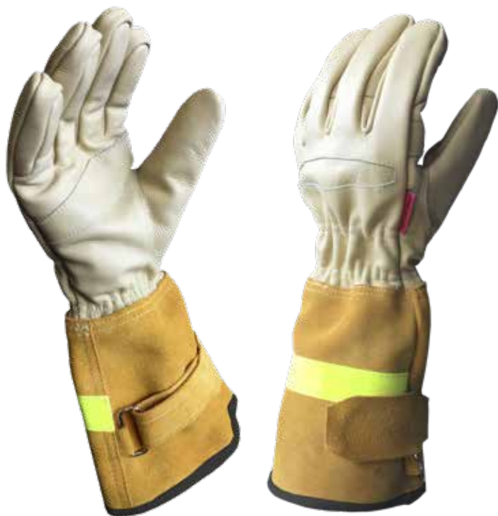
Patrón pulgar independiente