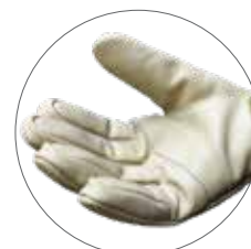
Cierre tipo Velcro®